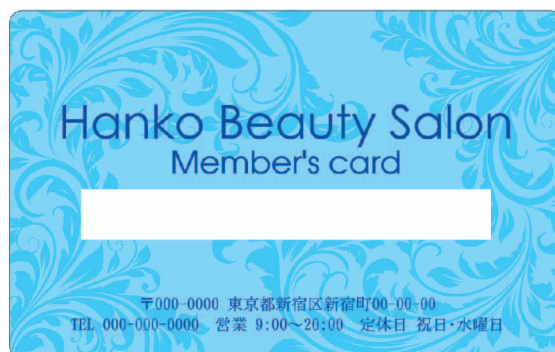
メンバーズカード2「水」