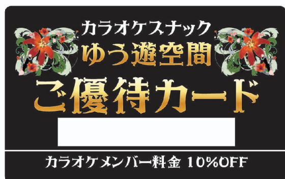
メンバーズカード3「ブラック」