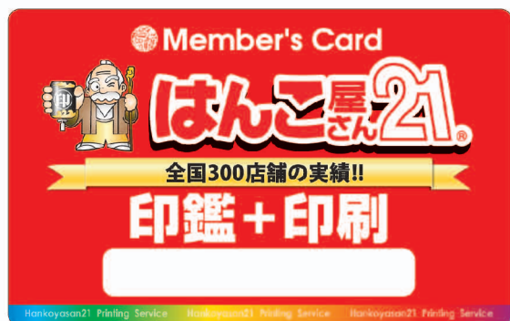
メンバーズカード1「赤」