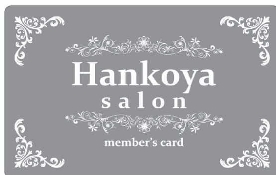
メンバーズカード4「シルバー」